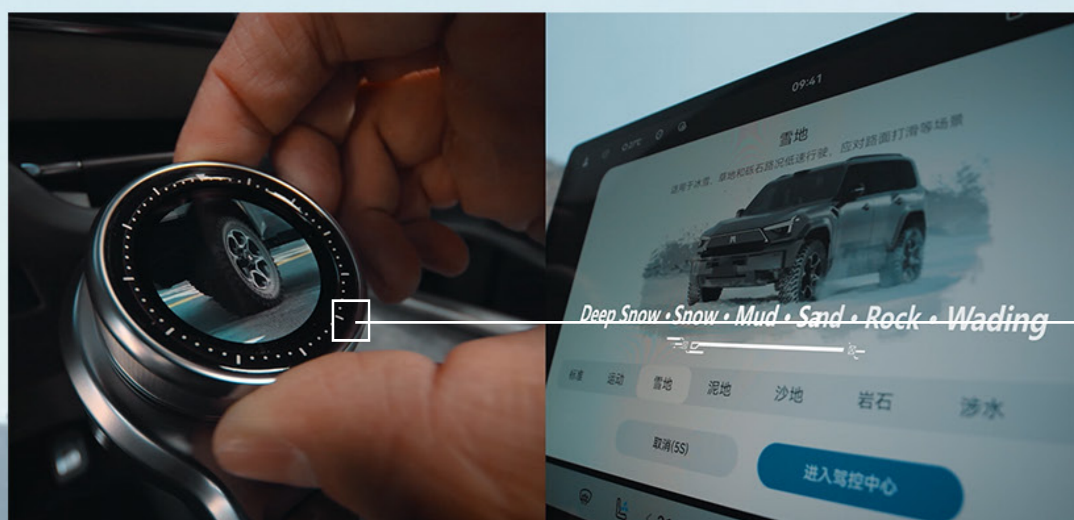
9 modos de conducción Detección automática del terreno inteligente