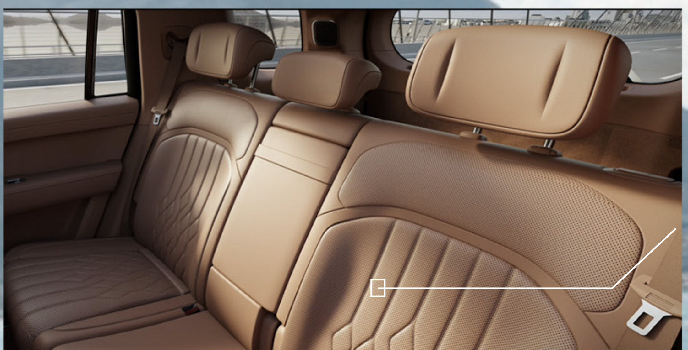
91,2% de cobertura suave al tacto, con piel napa